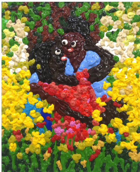
The lovers, 2023 Acrylique sur papier 40 x 30 cm