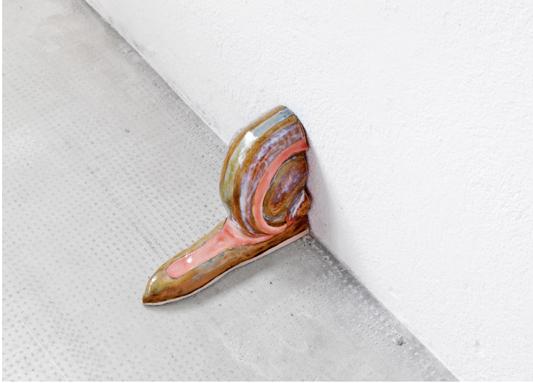
L'escargot , 2022 céramique 20 x 25 x 10 cm

Dans la chevelure rousse d'une femme amoureuse, Chloé Naucelle, puise son impulsion créatrice dans le bleu des fleurs, messagères de passion.