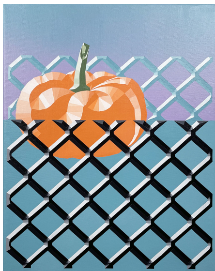
La pêche miraculeuse , 2023 Acrylique sur toile 40 x 30 cm

De l'imaginaire de Francisco Da Mata, naissent trois toiles autour de la table. Au menu, la fraîcheur des saveurs, un festin des sens. Un Apéro solo (sans alcool) , La grande caprese et La pêche miraculeuse sont autant d'invitations suspendues où s'entremêlent l'art d'un langage séduisant. En dessinant le programme d'un repas estival, apparaît le rouge vif de la tomate, une mozzarella crémeuse, l'éclat d'un verre, ou le vert d'une olive et du basilic. Les couleurs se rencontrent avec délice. Elles exhalent la saveur de ses toiles. L'artiste convertit même le fruit en source divine et miraculeuse. Francisco nous régale. Il éveille notre âme gourmande et complice