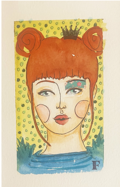
Aquarelle et collage sur papier 14,5 x 10 cm