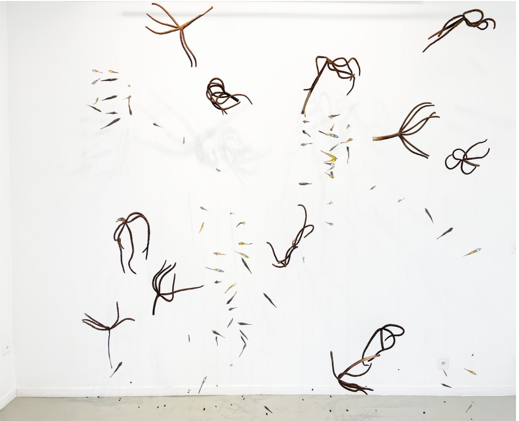
Méduse, 2023 Glycine, palmier lala et fils de soie Installation à dimension variable