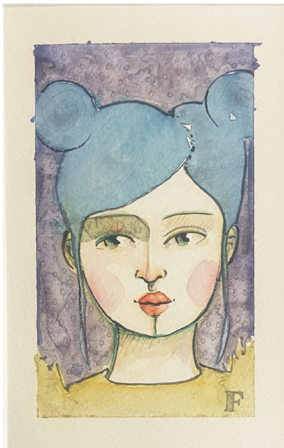
Aquarelle et collage sur papier 14,5 x 10 cm