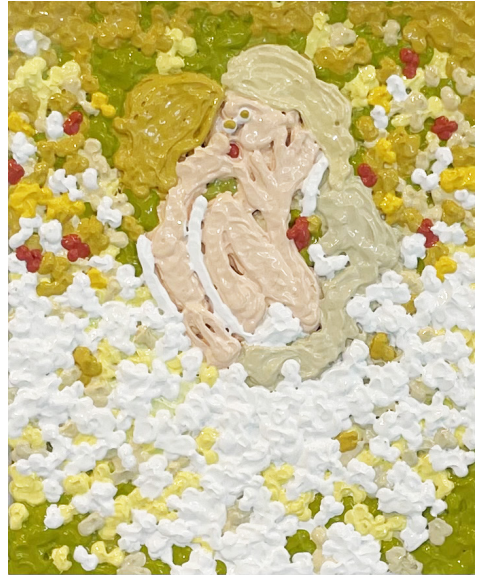
The lovers, 2023 Acrylique sur papier 40 x 30 cm

La série “The Lovers” de Christ Baptista reflète autant d’histoires d’amour qui jamais ne se reposent.