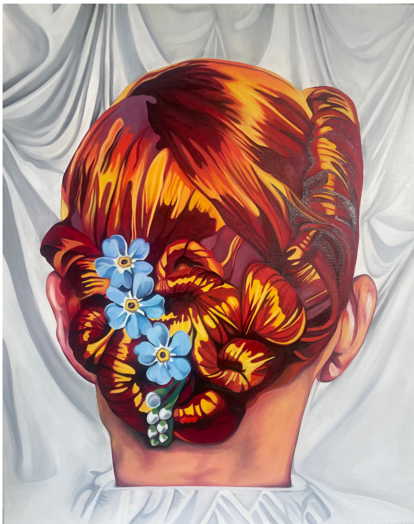
Fleur bleue , 2023 Huile sur toile 75 x 60 cm