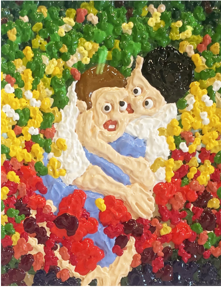
The lovers, 2023 Acrylique sur papier 40 x 30 cm