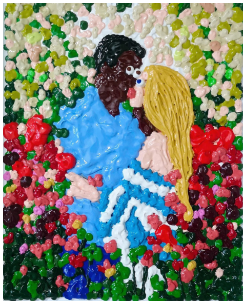
The lovers, 2023 Acrylique sur papier 40 x 30 cm