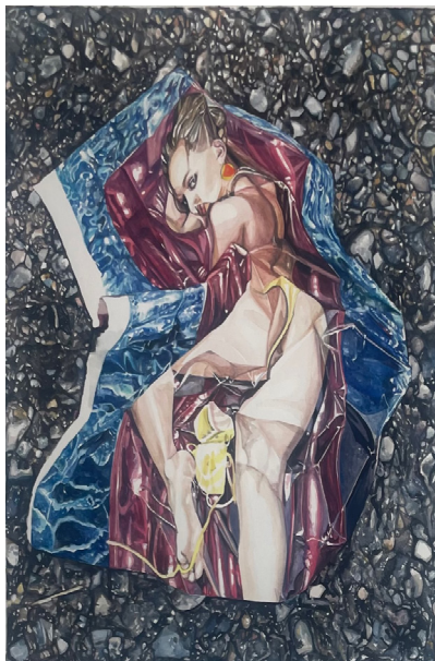
Penthouse , 2020 Aquarelle sur papier 36 x 28 cm