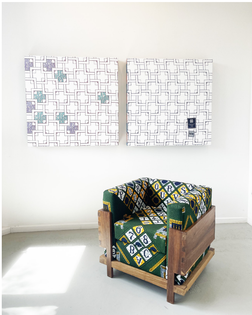
Double square (hommage à Mondrian), 2023 Acrylique sur tissu Wax 100 x 100 cm (chaque)