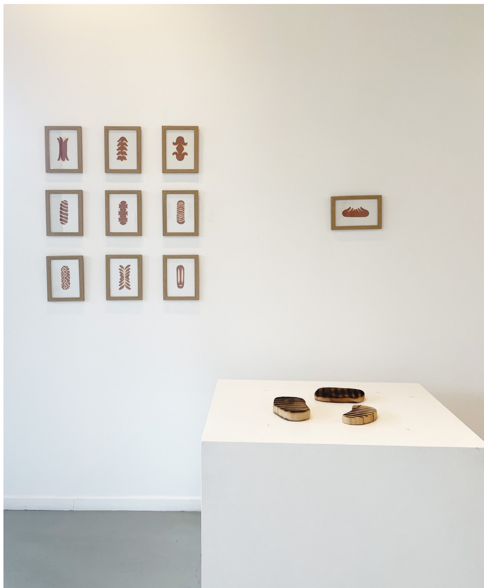
Cervelas Party , 2018 Feutre sur papier 30 x 20 cm (chaque)