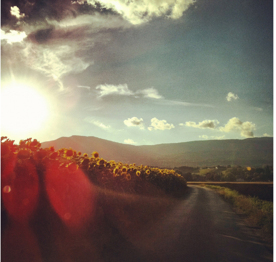
#photopoème, 2023 Photographie contrecollé sur PVC 81 x 81 cm