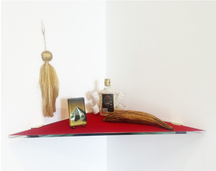
Nature morte à la serviette, 2023, installation de divers objet et peinture sur panneau de verre 53 x 53 x 40 cm