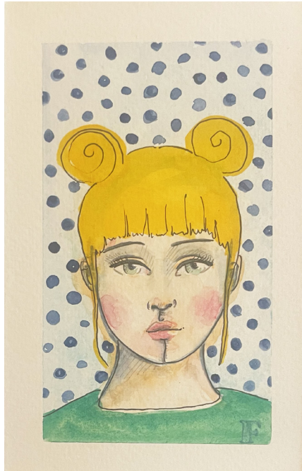
Aquarelle sur papier 14,5 x 10 cm

Les portraits de Florence Geiser naissent d'un univers fantaisiste. Chacune de ces femmes arbore sa palette de couleurs singulières, exprimant leurs émotions d'une vie passagère. Les couleurs acidulés sont les reflets de leurs états d'âme, qui dévoilent leur essence, leurs charmes et leurs flammes.